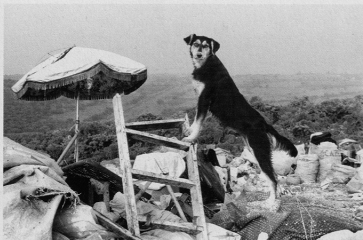
En hund ved parasollen, hvor skraldsamlerne holder pauser fra den stærke sol.