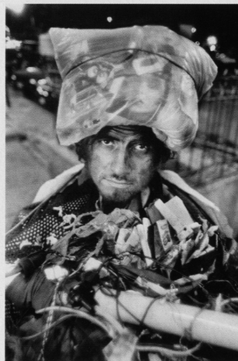
En vagabond i Cuernavaca, byen, der ligger i nærheden af lossepladsen.

Skraldsamlerne samler hele ugen og hele året – også i den regnfulde periode fra juli til oktober. Dagen begynder klokken syv om morgenen og slutter, når mørket falder på ved 19-tiden. De yngste på pladsen er fem år – de ældste 80, og det er et hårdt liv at være skraldsamler. Den gennemsnitlige levealder blandt Mexico Citys skraldsamlere er 39 år, mod 67 år for nationen som helhed. Hvert tredje barn dør, før det er fyldt et år. Kolera, dysenteri, tuberkulose, miltbrand og andre sygdomme hærger blandt los pepenadores, som de kaldes på spansk.